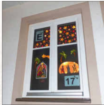
Grund- und Mittelschule Monheim