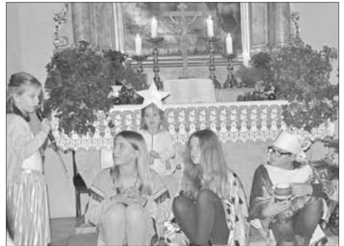
Ich folge auch dem Stern...