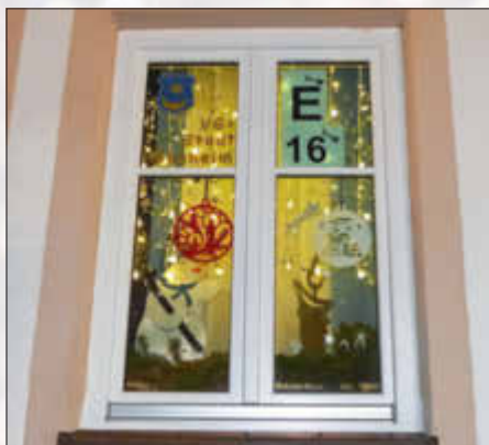
VG & Stadt Monheim