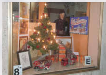
Freiwillige Feuerwehr Monheim