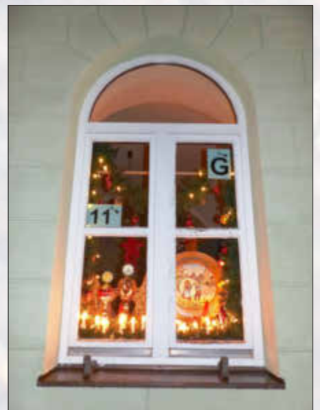
Schützengesellschaft 1858 Monheim e. V.