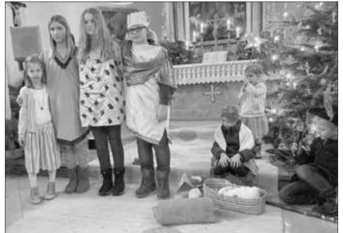
Freunde durch Jesus

Als der Afrikaner, die Chinesin, der Amerikaner und das deutsche Kind dann auf das Kind mit seinen Eltern im Stall trafen, schenkten sie ihm seine Gaben, wie eine Decke und etwas zu Essen und zu Trinken. Sie freuten sich miteinander über das Kind und darüber, dass sie durch Jesus Freunde geworden waren.