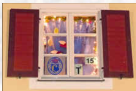
FG Gailachia Monheim