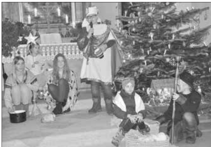
Ich komme von weit her...

Den diesjährigen Weihnachtsgottesdienst feierte man in der Peterskapelle zur Freude aller wieder mit einem Krippenspiel.