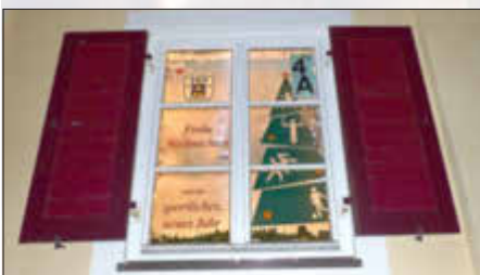
TSV Monheim 1895 e.V.