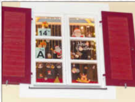
Kolpingsfamilie Monheim „Jugend“