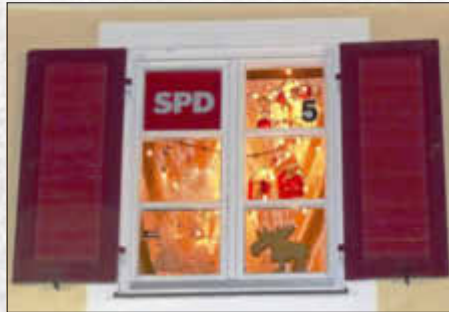
SPD Ortsverein Monheim