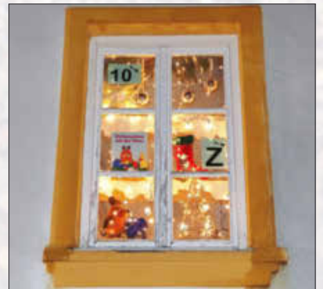
Pfarr- und Stadtbücherei Monheim