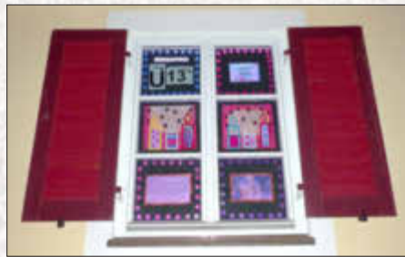
Liederkranz Monheim Kinderchor