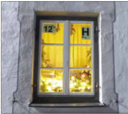
Kath. Frauenbund Monheim