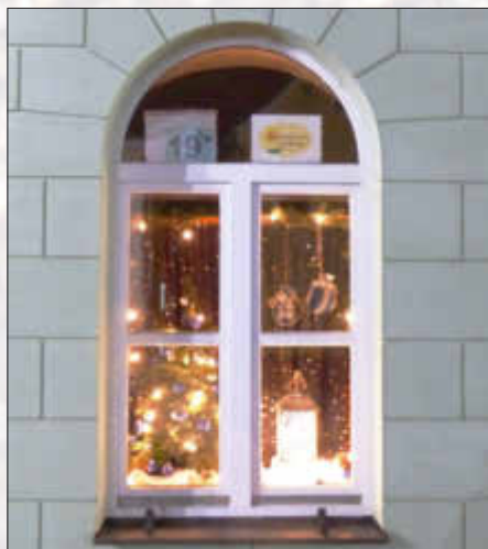
Verein für Gartenbau- und Landschaftspflege