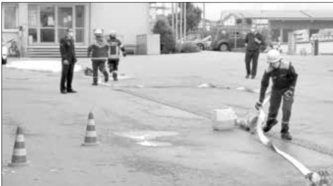
Aufbau des Löschangriffs zur Brandbekämpfung mittels Schaummitteleinsatz.

Die zweite Aufgabe bestand darin, ein nicht näher beschriebenes Einsatzszenario zu beüben. Hierbei gab es eine Reihe von möglichen Themen, die am Prüfungstag abgerufen werden können. Die Monheimer Jugend stellte ihr Können in Form einer Brandbekämpfung mit Schaummitteleinsatz unter Beweis. Natürlich gibt es auch hier einige Details, die es beim Einsatz von Schaum und der Brandbekämpfung zu beachten gibt. Lediglich Schläuche zusammenkuppeln und Feuer löschen ist dabei der geringste Aufwand. Doch da bereits viele Jugendliche seit vier, fünf Jahren in der Jugendfeuerwehr aktiv sind, meisterten sie diese Aufgabe mit Bravour.