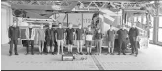
Die Teilnehmer der Jugendflamme Stufe 1 & 3