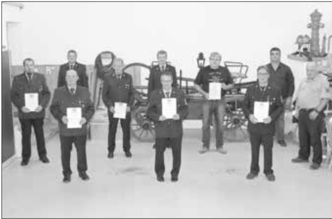
Ehrungen für aktive und passive Mitgliedschaft

Kleine Änderungen gab es bei den Neuwahlen und es konnten insbesondere Jüngere für die Übernahme eines Ehrenamtes dazu gewonnen werden. So setzt sich die neue Vorstandschaft wie folgt zusammen: