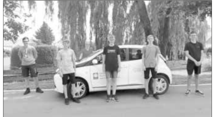
Ein Teil der Jugendlichen besuchte die Caritas Sozialstation in Monheim.

Wir helfen älteren und pflegebedürftigen Menschen bei alltäglichen Aufgaben, wie zum Beispiel die Einnahme von Medikamenten, die Aufrechterhaltung der Körperhygiene und hatten ein offenes Ohr für die Sorgen und Probleme der teils einsamen Patienten. Hierbei stellten wir fest, wie groß die körperliche als auch psychische Belastung für die Pfleger ist. Auch hier stehen die Mitarbeiter unter großem Zeitdruck und haben selten die Möglichkeit, ein persönliches Verhältnis zu den Patienten aufzubauen.