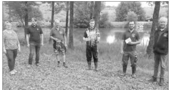
(Text und Foto: Fischereiverein Monheim e.V.)

Der Fischereiverein Monheim e.V. bedankt sich bei allen Anglern, Gästen, der Vertreterin der Stadt Monheim und bei unserem Sponsor.