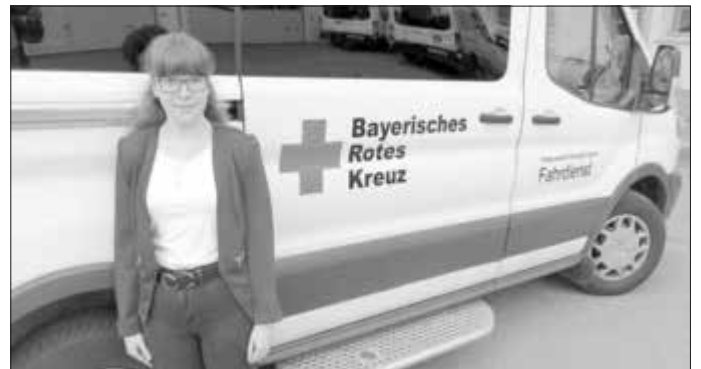
Ein anderer Teil besuchte den BRK Fahrdienst in Donauwörth.

Auch beim Fahrdienst des Bayerischen Roten Kreuzes konnten wir verschiedene Eindrücke sammeln. Diese Einrichtung hilft älteren und körperlich eingeschränkten Mitmenschen, ihre Mobilität nicht zu verlieren. Darunter fällt zum Beispiel die Dialysefahrt ins Krankenhaus, die Begleitung bedürftiger Menschen zur Arbeit und Schule. Auch Fahrten zu Erholungs- und Rehabilitationseinrichtungen gehören zum Aufgabenspektrum des BRK Fahrdienstes.