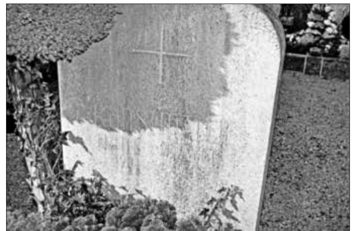
Die Grabstätte von Hans Mayer am Monheimer Friedhof, aufgelöst im Mai 2017