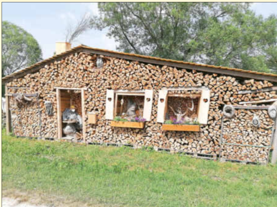
Ein Hingucker aus Holz - die Hütte am Radweg Ries 1 / Monheimer Alb