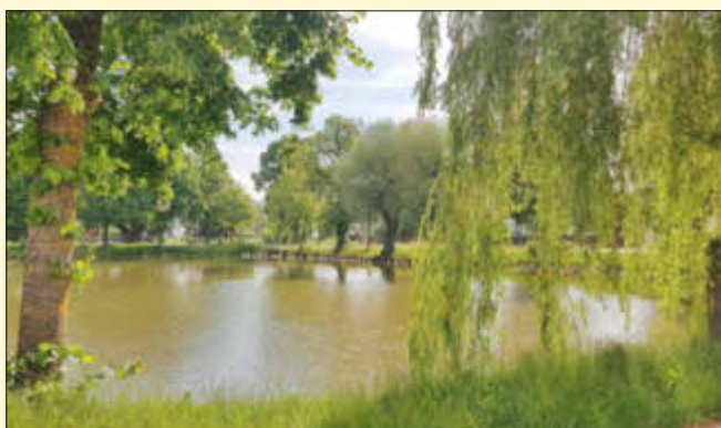
Schulweiher an der Monheimer Stadthalle