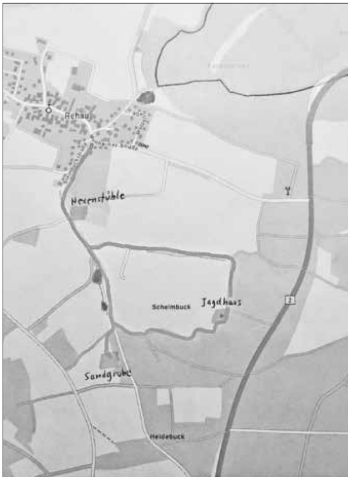
Die Wanderroute mit den Lesestationen