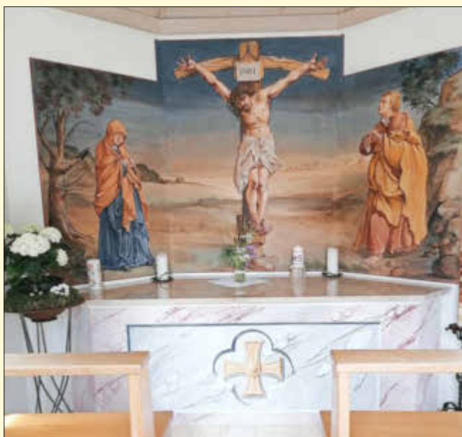
Innenraum der Kapelle in Kreut am Radweg Ries 1