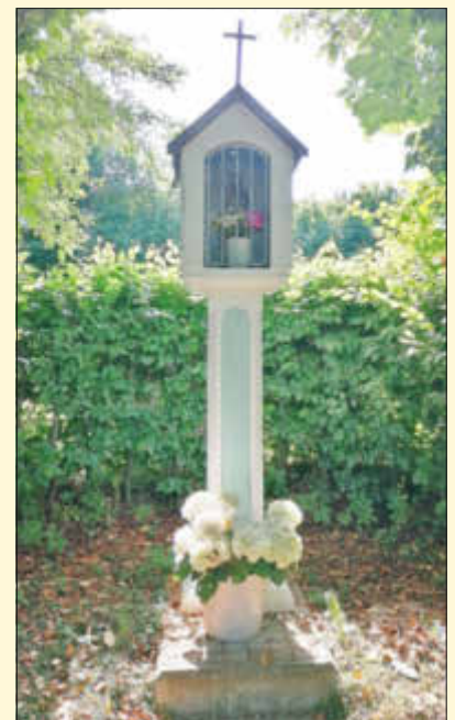
Bildstock am Radweg Monheimer Alb der Ussel entlang