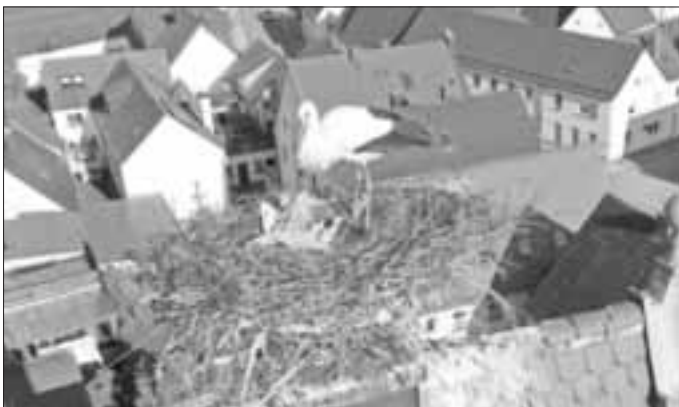
Wie auf dem Bild zu erkennen, sammeln die Altstörche beim Nestbau allerhand Unrat, wie z.B. Plastikfolie.

Ein Storch Ei wiegt ca. 100 – 120 Gramm. Nach 32 Tagen etwa ist der Dottersack, der ihnen als Energievorrat zur Verfügung stand, aufgebraucht und die Küken picken mit ihrem Schnabel das Ei kaputt. Das Schlüpfen dauert etwa 20 Stunden und sie sind dann völlig erschöpft.