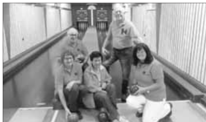
(Bilder + Text: Hedi Blank)

Letzten Sonntag fuhren wieder einige Mitglieder zum Bezirkskegeln nach Spalt. Monheim konnte wieder sehr gute Einzelwertungen erreichen. Herzlichen Dank für euren Einsatz.