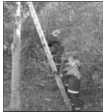
Mit Hilfe von Leitern mussten Katzen aus Bäumen gerettet werden

Hintergrund war dabei die Koordination der Mädchen und Jungen untereinander sowie der Einsatz von Leitern. Je drei Gruppen durften eine "Katze" von den drei Bäumen retten.