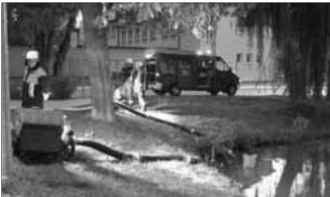
Mit zwei Pumpen wurde Löschwasser aus dem Schulweiher gepumpt und bis in die Stadtmitte befördert.

Ausgangslage war ein brennender Weihnachtsbaum im Flur des Rathauses. Der dadurch entstandene Rauch flutete das Treppenhaus und die offenen Flure. Die Feuerwehren aus Itzing, Kölburg, Flotzheim, Warching, Rehau, Wittesheim, Ried, Weilheim, Otting und Monheim mussten der Sache Herr werden. Während einige Wehren die Wasserversorgung aus dem Hydrantennetz und dem in der Nähe gelegenen Schulweiher sicherstellten, wurde durch die Kameraden der Ottinger und Monheimer Wehr der Innenangriff durchgeführt. Dabei wurde in jedem Stockwerk nach Personen gesucht, die durch den Rauch hätten eingeschlossen sein können. Da bekannt war, dass zu dieser Zeit eine Sitzung im Rathaus stattfand, wurde von außen über eine Leiter geprüft, ob und wie viele Personen im Saal anwesend waren. Diese Info ist für den Angriffstrupp wichtig, der die Rettung durchführen musste. Die Leiter diente außerdem als "zweiter Rettungsweg", falls durch den Brand der hölzerne Treppenaufgang im Rathaus unpassierbar geworden wäre. Schließlich konnten alle Personen aus dem Gefahrenbereich gerettet werden.