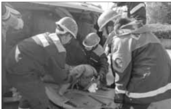
Rettung der Person aus dem Aowrack mit Hilfe des Spineboards

Auch hier stand wieder die Sicherheit an oberster Stelle. Mit fünf erfahrenen Mitgliedern der aktiven Wehrmannschaft wurden den Jugendlichen die aktuelle Situation erklärt und mögliche Vorgehensweisen erläutert. Neben der Ersten Hilfe stand das Stabilisieren des Fahrzeugs als erstes auf dem Plan. Den Jugendfeuerwehrlern wurde das System "StabFast" vorgestellt, mit der sich in sehr kurzer Zeit Objekte wie auf der Seite liegende Autos stabilisieren lassen. Mit Hilfe des hydraulischen Rettungsaggregats wurde das Dach des PKWs an einer Seite aufgeschnitten und umgeklappt, damit die Person im Inneren aus dem Fahrzeug befreit werden konnte. Dabei wurde von den erwachsenen Kollegen jeder Schritt genau erklärt und kurz demonstriert, ehe es die Jugendlichen selbst probieren durften.