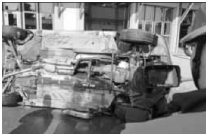
Mit der Wärmebildkamera wird auf weitere (mögliche) Brandstellen untersucht

Mit Hilfe des bereits bekannten Spineboards retteten die Mädchen und Jungen anschließend die Person aus dem verunfallten PKW. Das geschah keine Sekunde zu spät, denn just nachdem die Person befreit war, entfachte ein kleines Feuer auf der Unterseite des Fahrzeugs. Da aber auch der Brandschutz bei einem Einsatz sichergestellt werden muss, dauerte es nur wenige Sekunden, bis der Trupp mit Hilfe des Schnellangriffs das kleine Feuer am Fahrzeugboden gelöscht hatte. Mit Hilfe der Wärmebildkamera überprüften sie, ob es keine weiteren heißen Stellen am Fahrzeug gab. Schließlich war damit auch dieser Einsatz erfolgreich beendet worden.