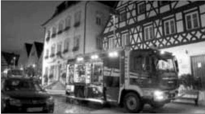
Das Monheimer HLF 20/16 vor dem Rathaus der Stadt Monheim.

Wie jedes Jahr fand auch heuer wieder Ende September die Feuerwehraktionswoche (auch als "Brandschutzwoche" bekannt) statt. Während dieser Woche beüben alle Feuerwehren in Bayern an unterschiedlichen Tagen bestimmte Objekte in ihrer Region. Geplant werden die Übungen von den jeweils zuständigen Kreisbrandmeistern. Heuer wurde in Monheim ein nicht zu unterschätzendes Szenario beübt.