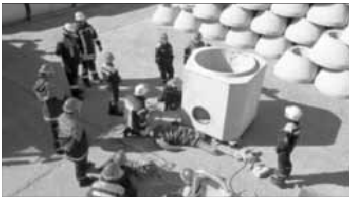
Mit Hilfe von Hebekissen versuchen die Jugendlichen die eingeklemmte Person zu befreien

An dieser Stelle muss auch nochmal erwähnt werden, dass die Sicherheit immer an oberster Stelle steht. Es waren zu jederzeit erfahrene Kameraden der aktiven Wehrmannschaft vor Ort, die unterstützt und Tipps zum Vorgehen gegeben haben und auch im Fall der Fälle hätten eingreifen können. Jederzeit wurde darauf geachtet, dass den Jugendlichen nichts passieren kann. Daher wurde auch bei diesem nicht ungefährlichen Einsatz auf sämtliche Gefahrenquellen hingewiesen und Grundsätze für die eigene Sicherheit erläutert.