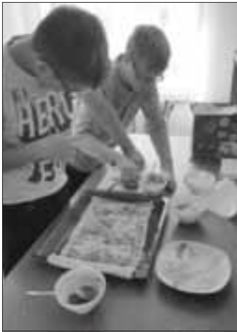
Pizza - Marke Eigenkreation