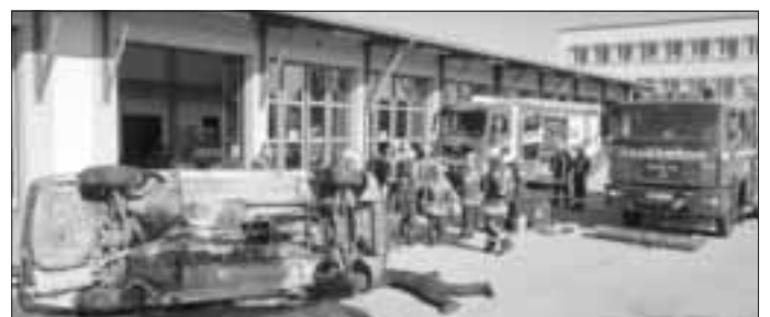
Ein PKW liegt auf der Seite. Darin ist eine Person eingeklemmt.

Am nächsten Morgen wurde gegen acht Uhr gefrühstückt und die ersten Aufräumarbeiten des Vorabends wurden durchgeführt. Gegen neun Uhr war wieder eine Schulung angesetzt. Da im diesjährigen Wissenstest das Thema Fahrzeugkunde anstand, gab es eine grobe Einführung in dieses doch etwas komplexere Themengebiet. Kurz darauf der nächste Einsatz: Unklare Rauchentwicklung in Hagenbuch. Kurz vor Eintreffen am Einsatzort kam dann jedoch die Abbestellung durch die Leitstelle. Es hätte sich lediglich um Gartenabfälle gehandelt, die verbrannt worden seien. Über die vor erst wenigen Stunden neu geöffnete B2 wurde wieder Richtung Feuerwehrhaus gefahren. Während der Fahrt ging allerdings ein neuer Einsatz ein: Schwerer Verkehrsunfall mit eingeklemmter Person.