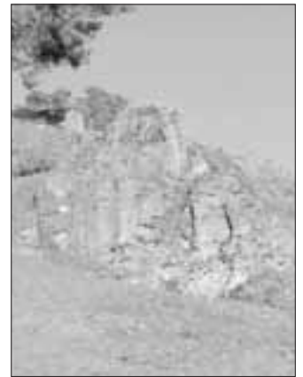
Die beschmierte Felswand

Ebenso haben Unbekannte am Waldkindergarten Monheim randaliert.