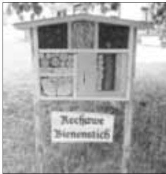
Das neue „Bienenhotel“ in Rehau