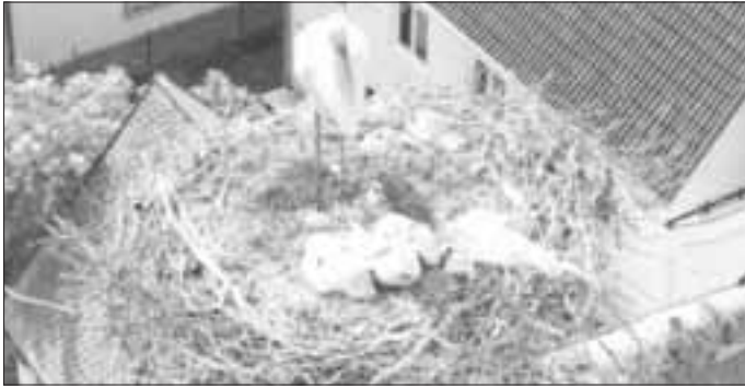
Die drei Küken wachsen und gedeihen.

(Text: Wolfgang Wild)