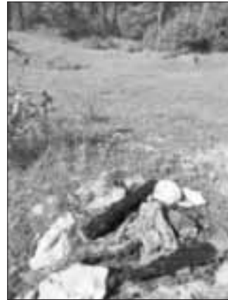
Reste vom Lagerfeuer

Von Seiten der Stadt Monheim wurde Anzeige gegen Unbekannt erstattet.